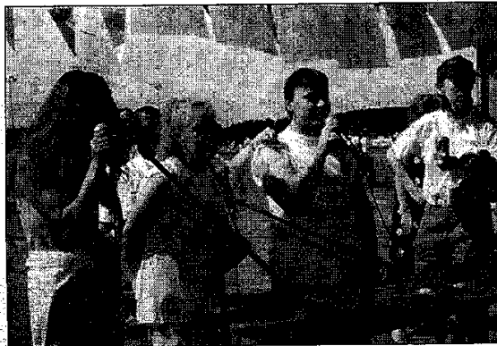
L'animation karaoké proposée par le CLAJ (Clermont loisirs animation jeunesse) a eu un franc succès.

L'association du CLAJ (Clermont loisirs animation jeunesse) tenait un stand karaoké et maquillage fort apprécié du public. «L'association a été créée il y a 6 ans au sein du service jeunesse pour répondre au manque d'animations à destination des jeunes. Au début, nous organi-