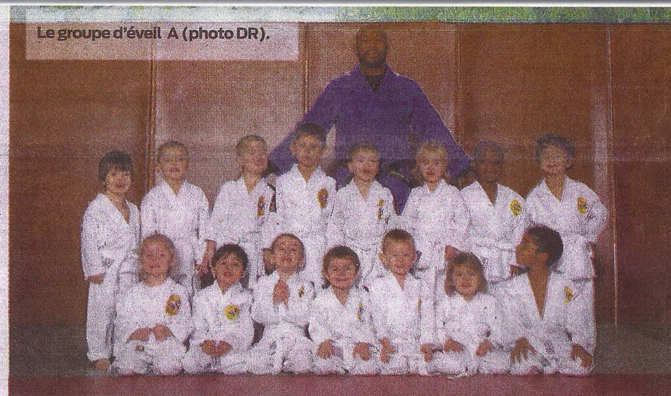
Le groupe d'éveil A.