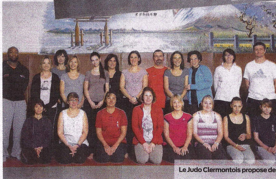
Le Judo Clermontois propose des séances de taïso.