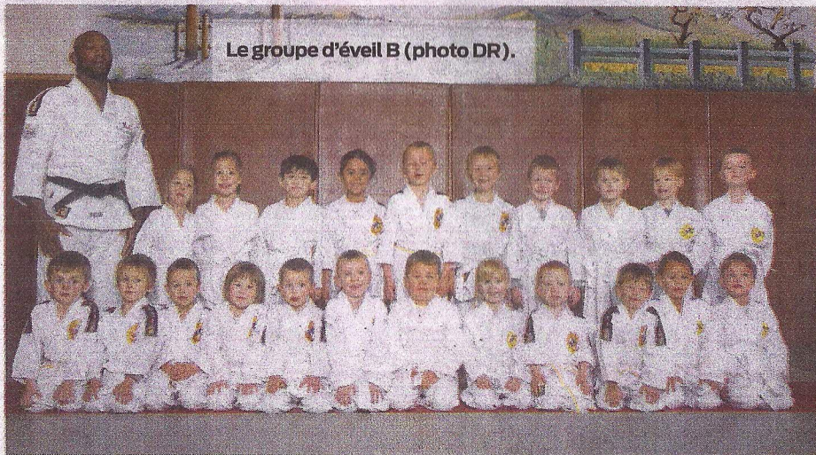
Le groupe d'éveil B.