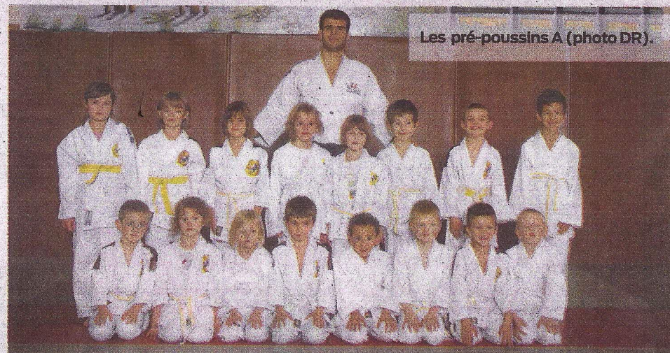
Les pré-poussins A.