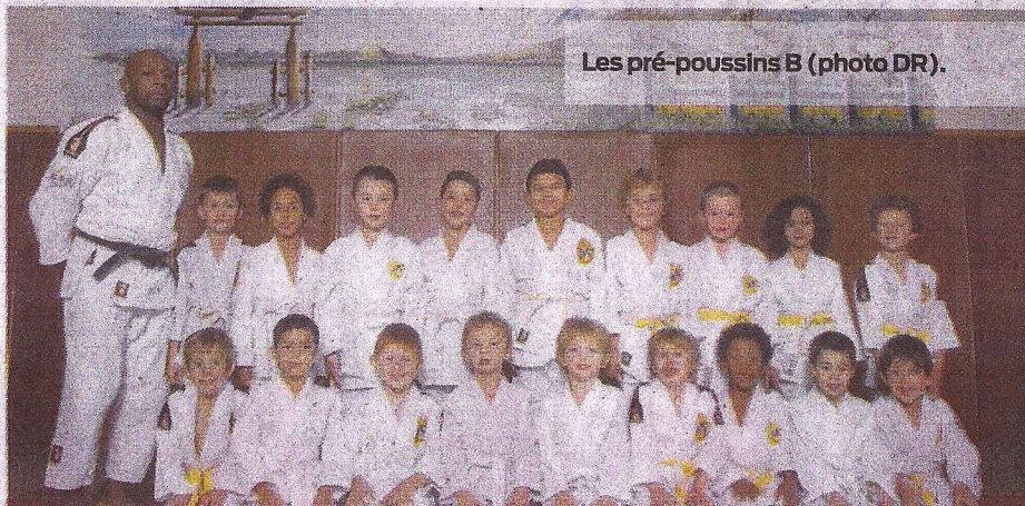
Les pré-poussins B.