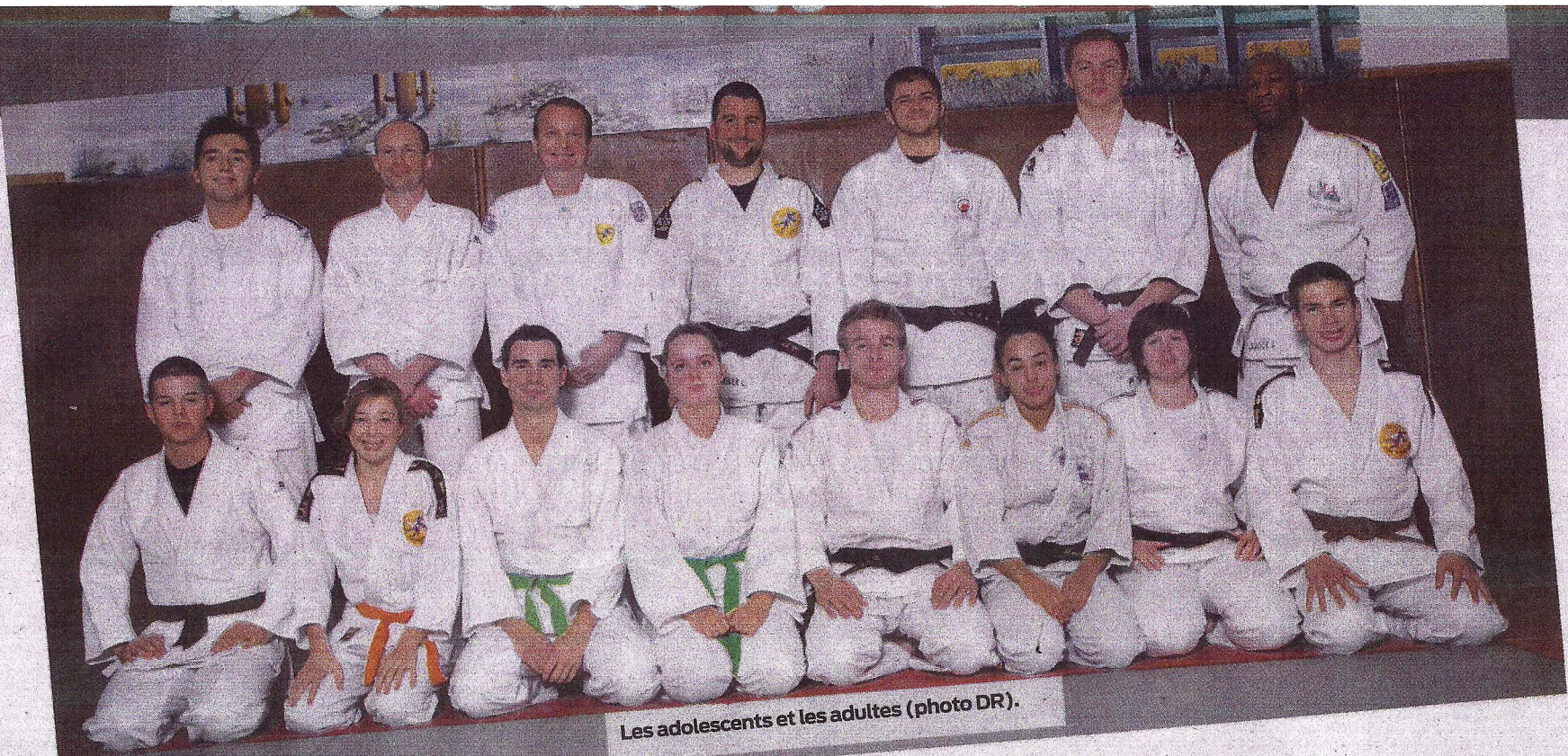
Les adolescents et les adultes (photo DR).